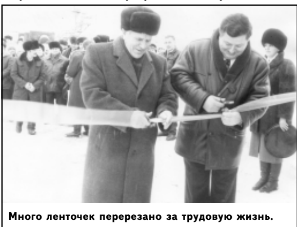
Много ленточек перерезано за трудовую жизнь.