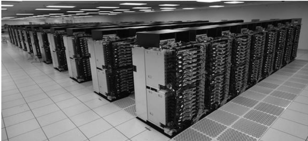
Рисунок 3. Суперкомпьютер «Sequoia»