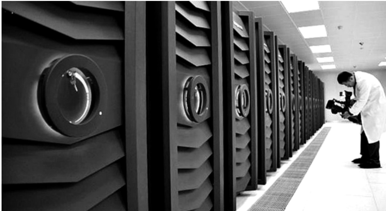
Рисунок 5. Суперкомпьютер «Sunway BlueLight»