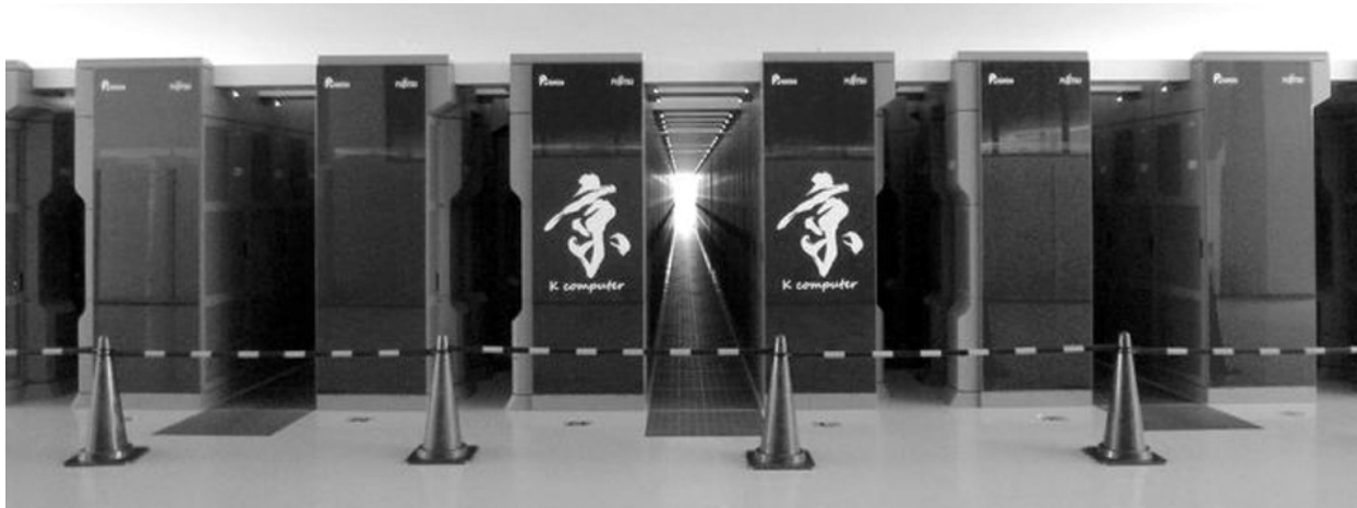
Рисунок 4. Суперкомпьютер «K computer»

Суперкомпьютер «Sunway BlueLight» (Рисунок 5) занимал 14 место в ноябрьской редакции 2011 года списка Top500. Формально, система не имеет сверхвысокой производительности — система не входила в Top1–10,— но используемые решения явно соответствуют этому уровню. Суперкомпьютер создан и расположен в Китае 16 , область использования: исследования. Разработан кооперацией китайских компаний 17 на базе китайских процессоров ShenWei SW1600 16C 975MHz (16 ядер в процессоре). Система создана без использования ускорителей вычислений. В системе: 8575 процессоров, 137 200 ядер. Системная сеть собственной разработки, как отдельное решение — не доступно. Охлаждение — жидкостное.