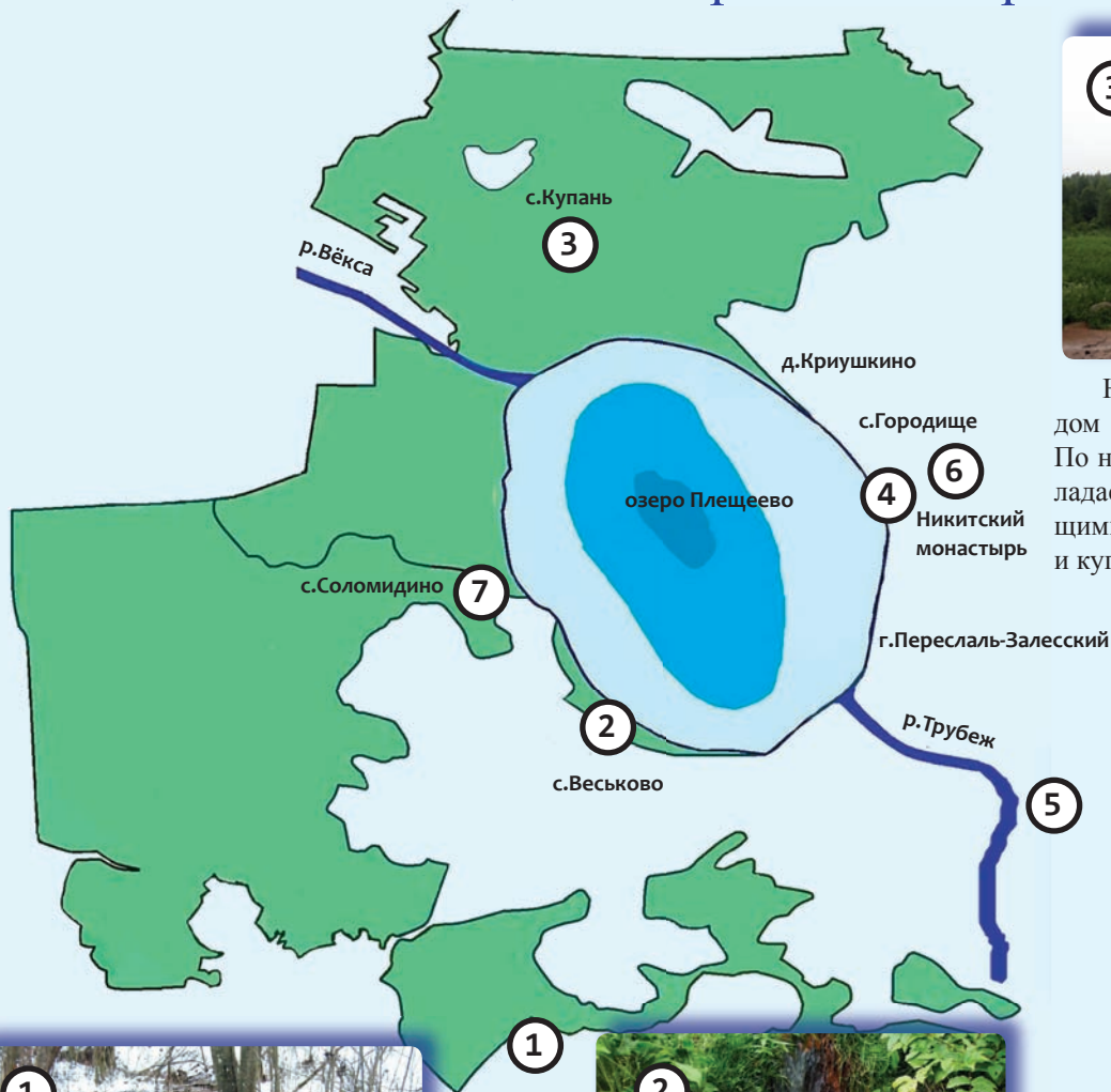
СХЕМА РАСПОЛОЖЕНИЯ родников на территории национального парка «Плещеево озеро» и его окрестностей