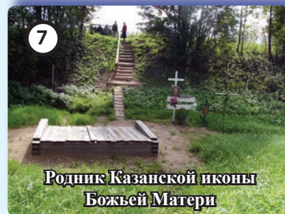
Родник Казанской иконы Божьей Матери

Расположен в километре от Никитского монастыря, в пойме реки Большая Слуда. Ископан переславским чудотворцем Никитой Столпником в XII веке. Вода считается святой и исцеляющей от многих болезней.