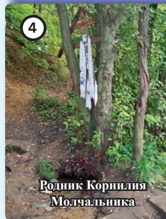
Родник Корнилия Молчальника

Находится за урочищем Кухмарь, рядом со старой дорогой на село Купань. По народному поверью вода родника обладает целебными свойствами, приходящими от Святой Варвары. Есть часовня и купальня.