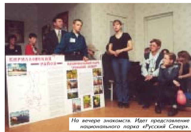
На вечерах знакомств. Идет представление национального парка «Русский Север».