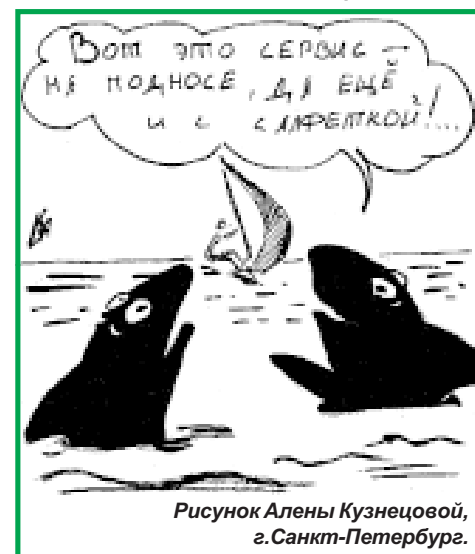
Рисунок Алены Кузнецовой, г.Санкт-Петербург.

«Юные Друзья Природы», школа №7, г. Тутаев.