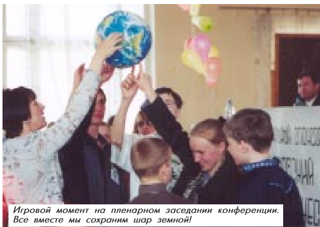
Игровой момент на пленарном заседании конференции. Все вместе мы сохраним шар земной!

20-21 апреля в Переславлe проходил настоящий экологический праздник, на который в НП «Плещеево озеро» съехались школьники из Москвы и Ярославля, Тутаева и Некрасовского, Александра (Владимирской обл.) и подмосковных Королева и Дзержинского, городов Нелидово и Андреаполь (Тверской обл.), г.Великие Луки (Псковской), из Череповца и Кириллова (Вологодской), Иркутска, Калуги и Костромы, а также из республик Карелия и Хакасия.