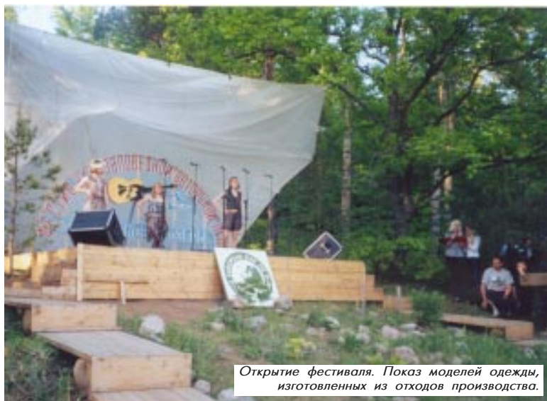
Открытие фестиваля. Показ моделей одежды, изготовленных из отходов производства.

Четвертый фестиваль заповедной авторской песни прошел 24-26 мая в национальном парке «Смоленское Поозерье». На нем были представлены такие ООПТ, как: НП «Зюраткуль» (Челябинская обл.), НП «Лосинный остров» (Московская обл.), НП «Плещеево озеро» (Ярославская обл.), НП «Угра» (Калужская обл.); заповедники: «Брянский лес» (Брянская обл.), «Приокско-Террасный» (Московская обл.) и «Полистовский» (Псковская обл.). Природоохранные организации представляли гости из Департамента окружающей среды г.Москвы, Уральского отделения WWF, МПР РФ, ЭкоЦентра «Заповедники», ЦОДП (г.Москва). Примечательно, что все большие начальники Смоленщины почтили своим присутствием песенный праздник, вышедший далеко за рамки регионального. Его по полному праву можно считать международным, так как, кроме 32 населенных пунктов из 14 регионов России, были представлены четыре региона Белоруссии, а также Финляндия и Германия.