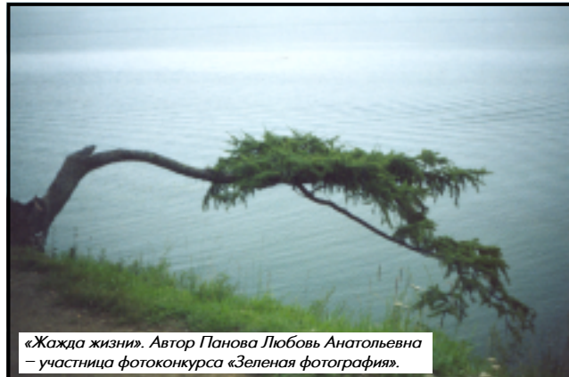
«Жажда жизни». Автор Панова Любовь Анатольевна – участница фотоконкурса «Зеленая фотография».

сад им. С.Ф. Харитонова общей площадью 58 га, на которой произрастают более 600 видов древесных и кустарниковых пород. Большая часть из них интродуцирована и акклиматизирована. Выделены отделы – экспозиции: Северная Америка, Крым и Кавказ, Дальний Восток, Япония и Китай и другие. Сад зарегистрирован как опорный пункт в Международном ката-