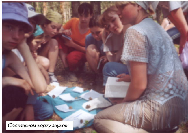
Составляем карту звуков

Лагерь «Дети Волги» проводится в рамках программы по эколого-краеведческому детскому движению «Мы – дети Волги» Верхне-Волжского региона. Это ключевое мероприятие нашей программы.