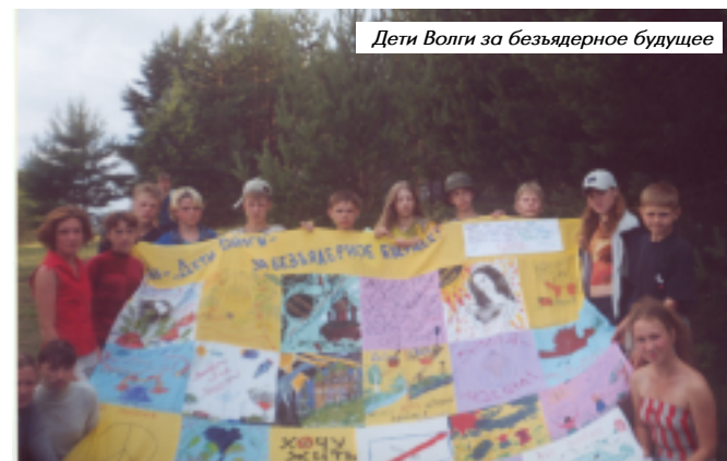
Дети Волги за безъядерное будущее

Богатым был ребячий досуг. Наиболее запомнились детям народные игры, конкурс «Дегустация блюд», спортивные соревнования, «ночная игра». И, конечно, неотъемлемая часть каждого лагеря – день Ивана Купалы, знакомство с народными обрядами, песнями, хороводами. Ребята играют в театрализованном представлении и факельном шествии, прыга-