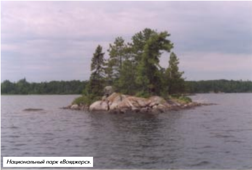
Национальный парк «Вояджерс».

напоминает кадры из фильма «А зори здесь тихие...» — крутые берега озёр, покрытые вековым хвойным лесом, замшелые скалы, уходящие в холодную чистую воду. Всё как в русском Нечерноземье, относящемся к зоне европейской тайги.