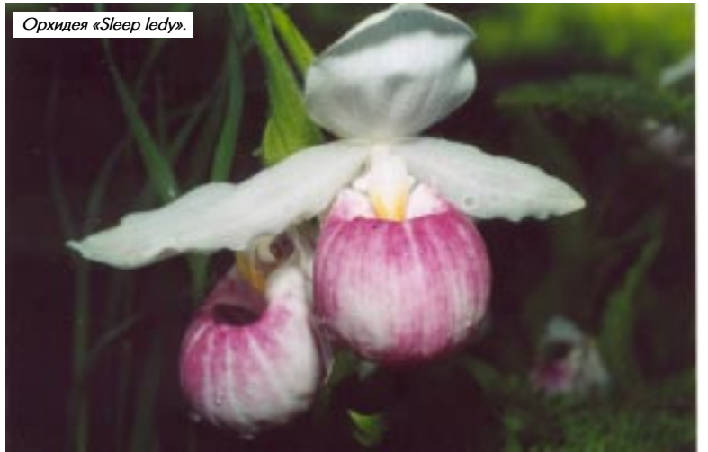
Орхидея «Sleep lady».

мачка, занесённого в международную Красную Книгу. Американцы называют свою орхидею Sleep Lady («спящая леди»). Эти замечательные цветы являются одним из символов штата Миннесота. В национальном парке повсюду размещены призывы к посетителям не рвать башмачки. Эта любовь и бережное отношение к «национальным» цветам принесла свои плоды — «спящая леди» сейчас растёт по всему штату, причём не только в дремучих заповедных лесах, но и в кустарниках около ранчо, кемпингов или сервис-центров. А эти снимки цветущих орхидей были сделаны в придорожной канаве.