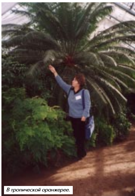
В тропической оранжерее.

Ботанический сад Ботанического института им. В.Л.Комарова – выдающегося