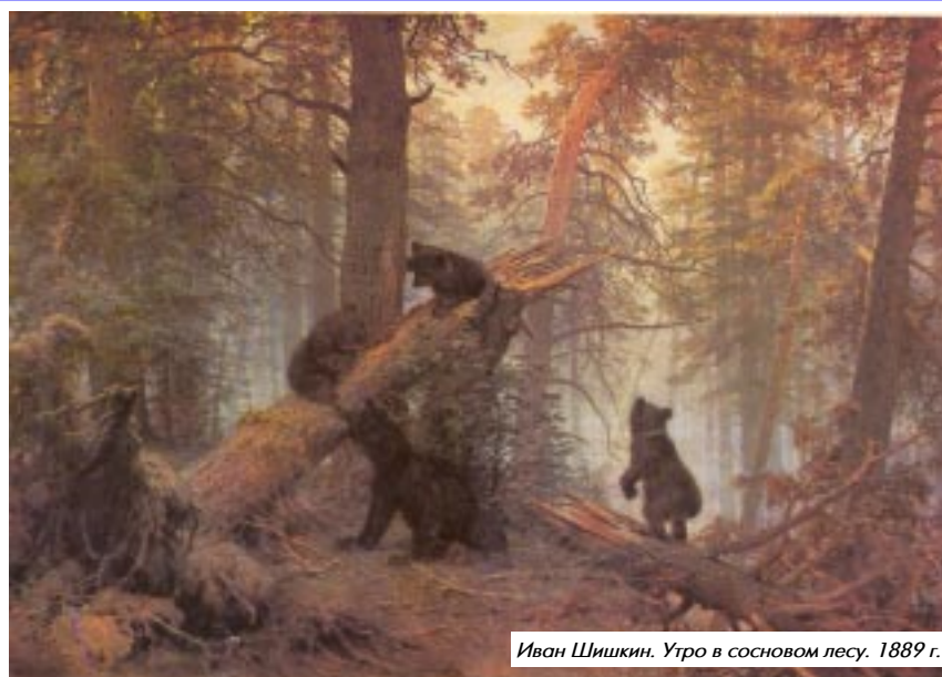
Иван Шишкин. Утро в сосновом лесу. 1889 г.