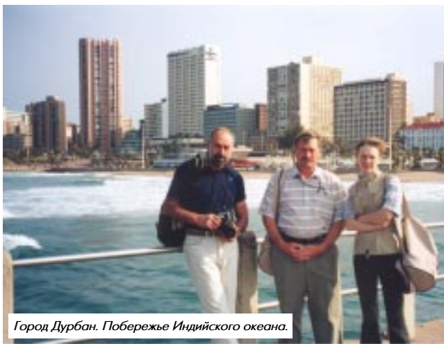
Город Дурбан. Побережье Индийского океана.

В сентябре 2003 года в г. Дурбане (ЮАР) проходил V Всемирный конгресс национальных парков, в котором приняло участие около 2,5 тысяч человек из 170 стран мира. Конгресс проводится каждые 10 лет, на нем разрабатывается стратегия развития охраняемых природных территорий. Предыдущие встречи проходили в Сиэтле (1962), Йелоустоне (1972), Бали (1982) и Каракасе (1992).