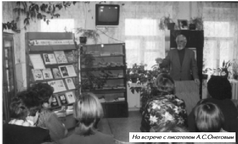
На встрече с писателем А.С.Онеговым

В детской библиотеке писатель встречался с экологической общественностью города, учителями, воспитателями дошкольных