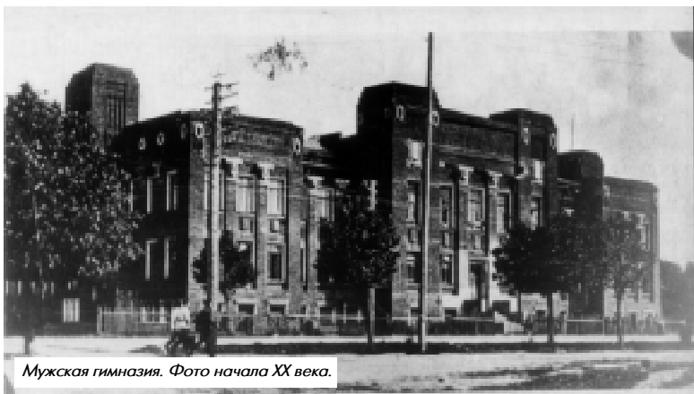
Мужская гимназия. Фото начала XX века.

«Имею честь ответить на Ваше предложение... принять на себя труд по составлению про-