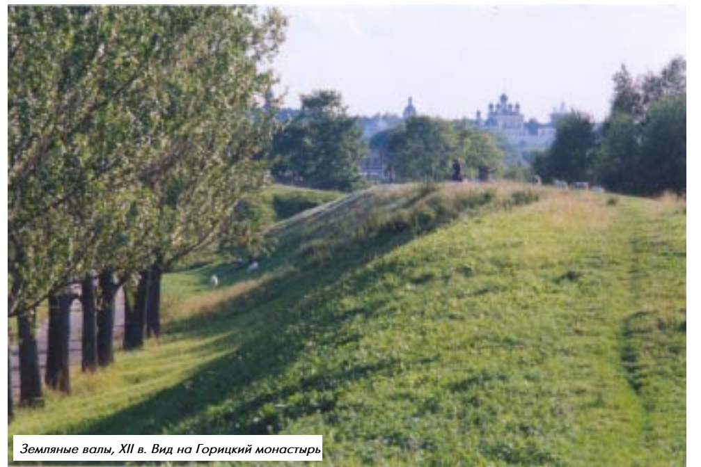
Земляные валы, XII в. Вид на Горичский монастырь

Проведённые исследования показали, что представители разных семейств играют неодинаковую роль в формировании флоры земляного вала. Наиболее часто встречаются на валу представители семейств сложноцветных, крестоцветных, зон-