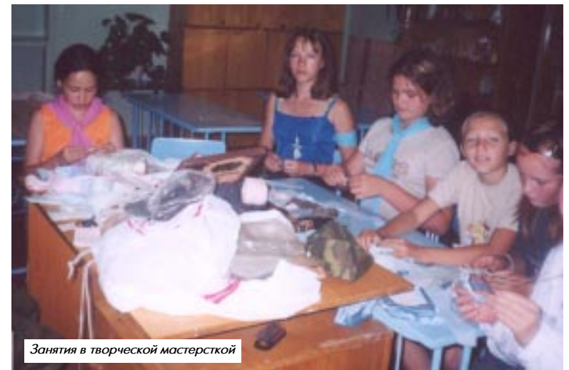
Занятия в творческой мастерской

ли девичьи хороводы. Такие куклы встречаются в музее в карельских Кижях и в деревне Мартыново Мышкинского района Ярославской области, жители которых, судя по диалекту, укладу жизни, имеют мерянские корни. Поэтому кукла, видимо, имеет финно-угорское происхождение.