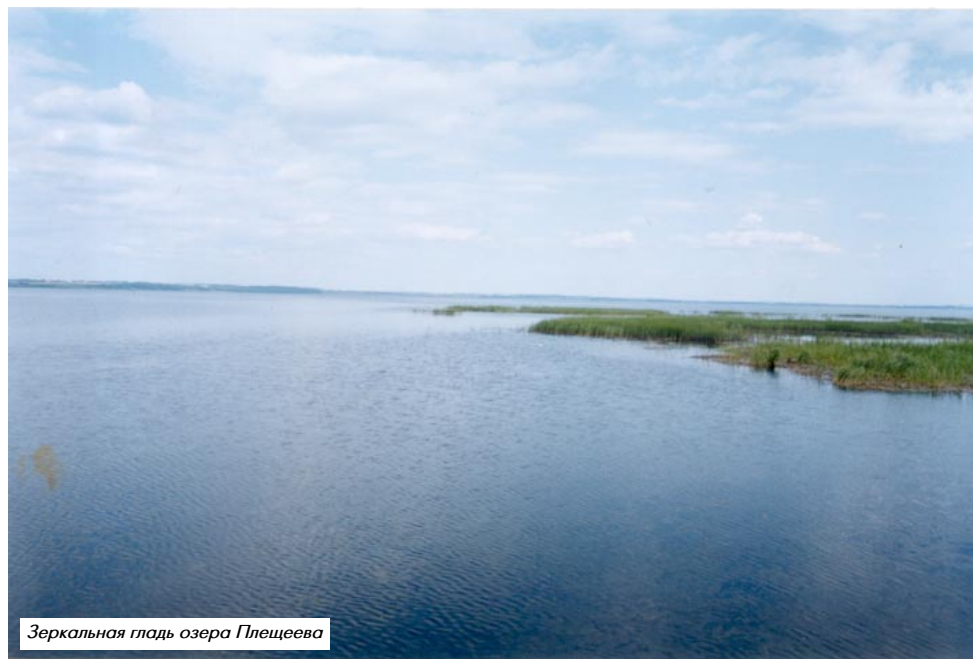
Зеркальная гладь озера Плещеево

В-четвертых, жителям территорий с индивидуальной застройкой г.Переславля надо обращаться к депутатам городской Думы, к представителям администрации города о вывозе ТБО. Но здесь сразу вопрос – это платная услуга, а платить люди не хотят. Нужны соответствующие постановления администрации г.Переславля и Переслав-