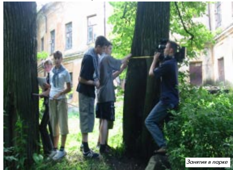
Занятия в парке

Во второй раз школа «ЛиС» проходила в усадьбе Свиных, пять лет назад впервые учащиеся приехали в с. Смоленское, чтобы научиться жить в гармонии с окружающим их миром природы. Юбилейная пятая школа «ЛиС» была посвящена Миру русской усадьбы.