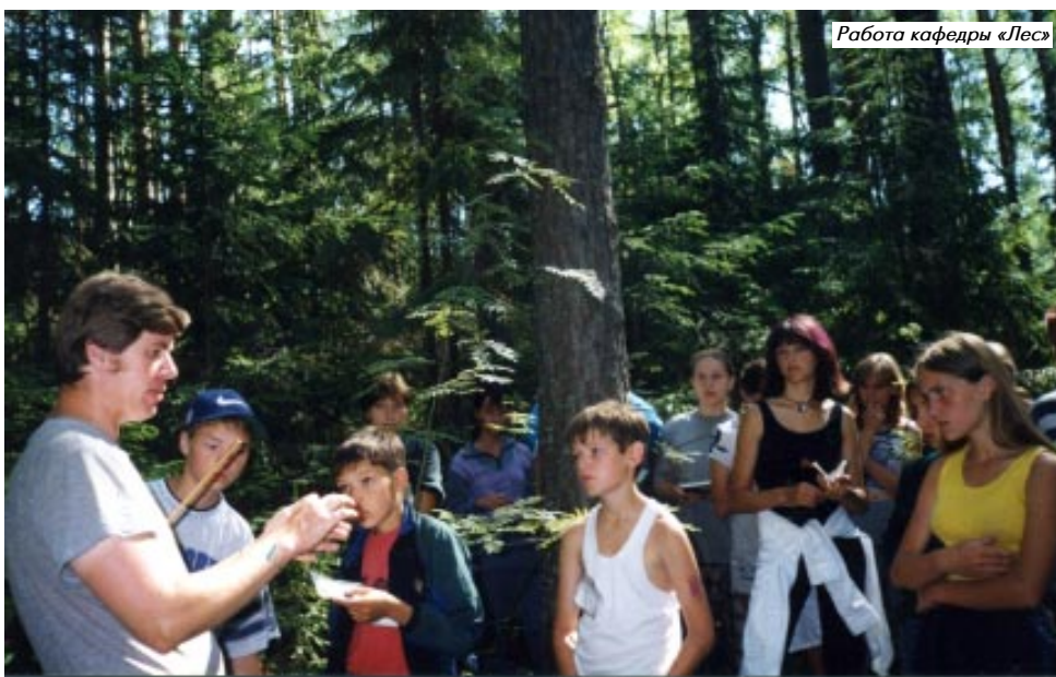
Работа кафедры «Лес»

Как родник, пробивающийся к жизни маленькими струйками, превращается сначала в ручей, а потом в реку, так и движение «Мы – дети Волги» наполнялось новыми начинаниями, идеями.