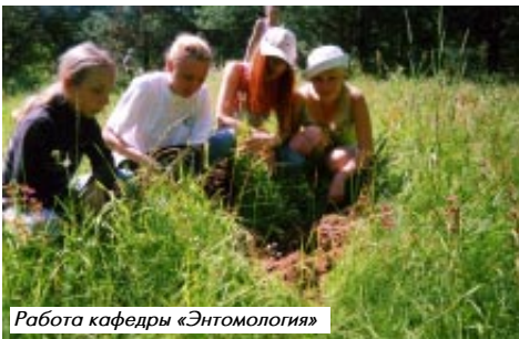
Работа кафедры «Энтомология»