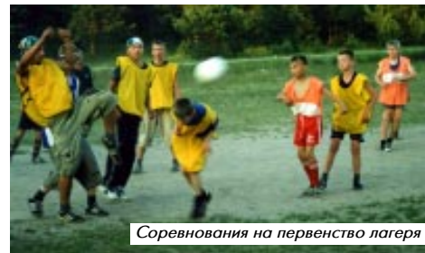
Соревнования на первенство лагеря