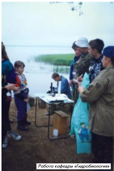
Работа кафедры «Гидробиология»

обрядовыми моментами. Все это предшествует красивому народному празднику Иван Купала, который проходит в ночь на 7 июля. Специалисты национального парка нашли старинные обрядовые хоромы, песни наших предков звучали над плещеевской водой и, конечно же, венки из цветов с зажженными свечами уплывали все дальше от берега озера. Ранним утром, когда золотая солнечная дорожка пробежала по плещеевской воде, мы увидели наши венки, плывущие все дальше, как будто частички души уносили они с собой в далекое будущее. Станут ли эти праздники традиционными, теперь зависело только от нас. Ночная сказка-игра, связанная с семью законами Коммонера, закончила первый экспедиционный лагерь «Мы – дети Волги».