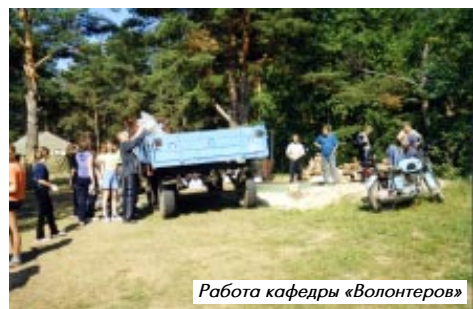
Работа кафедры «Волонтеров»

Кроме традиционных кафедр в этом лагере работала отдельная кафедра волонтеров – «Организуем отдыхающим горожанам цивилизованный туризм» – одни обустроили места отдыха на берегу озера Плещеево; «Освободим лес от сучастия!» – другие расчищали елочные насаждений от сушняка. За дни работы волонтеры лагеря собрали более 3-х тонн мусора.