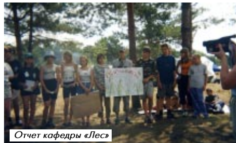
Отчет кафедры «Лес»