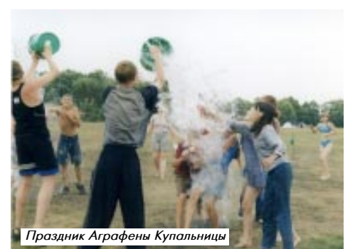
Праздник Аграфены Купальницы

Купальская ночь – кульминационный момент лагеря, которого ждут все и взрослые и дети, самому маленькому участнику экспедиции было 2 года, но и он не заснул в эту ночь. Обрядовые хороводы и песни проводил фольклорный ансамбль из Ростова Великого, Аграфена Купальница рассказала об обрядах и обычаях наших предков, много нового мы узнали о празднике Ивана Купала, ведь при подготовке использовались архивные документы о празднике, находящиеся в Ростовском краеведческом музее.