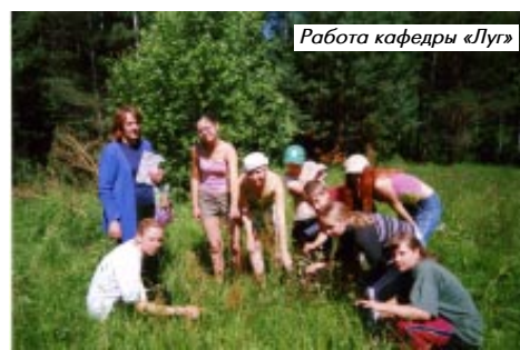
Работа кафедры «Луг»

Вот и закончилась очередная экспедиция. Кто на следующий год примет любознательных и увлеченных исследователей, пока не знаем, но, уверены, что есть в России уголок, где нас встретят с радостью и душой, как это принято на Руси.