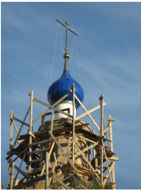
(Окончание. Начало в № 2 (38).)

Об этом храме надо говорить особо. Наиболее полное описание его истории мы найдем в «Историко-статистическом описании церквей и приходов Владимирской епархии» в разделе «Описание церквей и приходов Переславского уезда 1895 г.» его второго выпуска «Переславский и Александровский уезды», составленного преподавателем Владимирской семинарии В. Добронравовым и дозволенным к печати цензором священником Григорием Дьяченко. Напечатан этот труд был в типолитографии В. Паркова в городе Владимире в 1895 году.