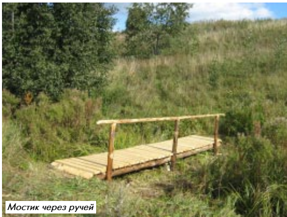
Мостик через ручей