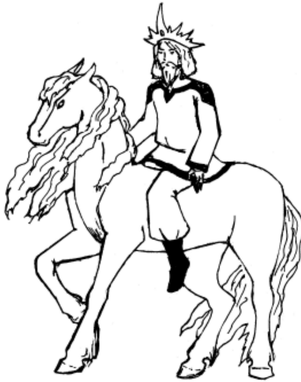
«Тарх» – Дажьбог. Рис. Людмилы Анатольевой

географической точки Ярославской области.