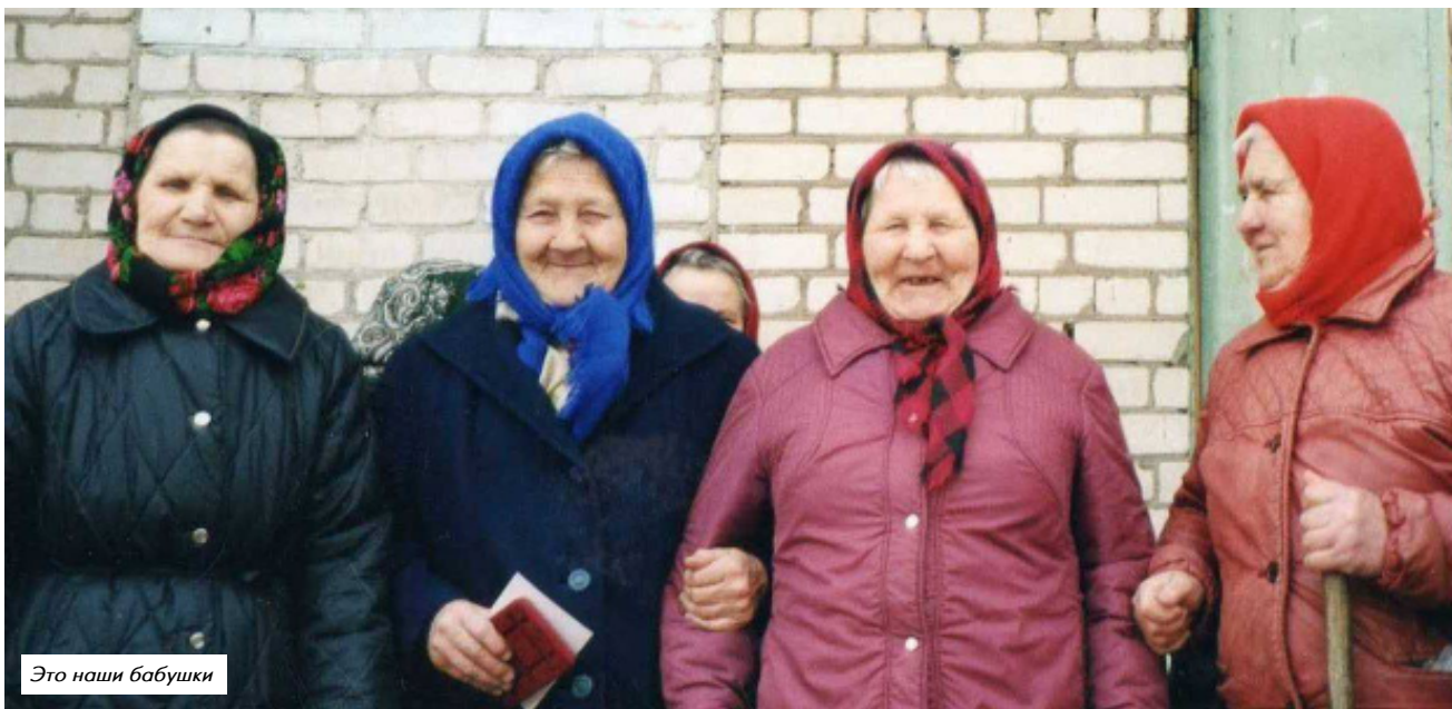
Это наши бабушки