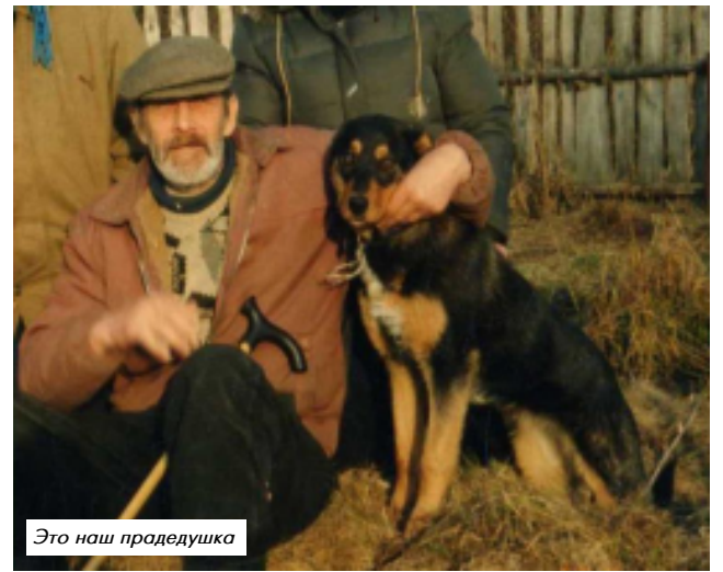
Это наш прадедушка

Например: Вот как будет звучать фраза «Потомки хо-