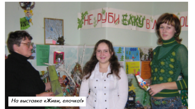
На выставке «Живи, елочка!»