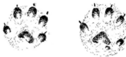
Отпечатки лап ласки: передней – справа и задней – слева

Как и другие представители семейства куньих, ласка отличается изрядным любопытством. Известны случаи, когда зверёк, заглянув на потолочной балке в зернохранилище, продолжительное время наблюдал за работой женщин, насыпавших зерно в мешки. За фермером, укладывающим кипы сена в тележку, зверёк наблюдал стоя «столбиком» наверху штабеля. В природе видеть ласку доводилось рыбакам, грибникам, туристам и, конечно же, сотрудникам национального парка. К сожалению, далеко не всегда встреча с человеком оказывается благополучной для ласки.