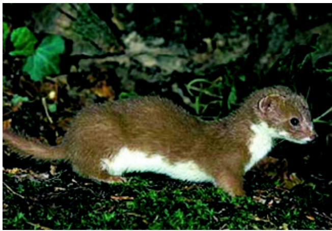
Класс Млекопитающие, Отряд Хищные, Семейство Куньи.

Самый маленький хищник, проживающий на территории национального парка «Плещеево озеро» относится к семейству куньих. Это – ласка ( Mustela nivalis ), длина тела которой даже у самых крупных самцов не превышает 28-ми, длина хвоста – 9-ти см, а вес – 100 гр.