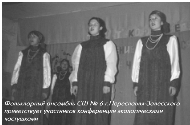
Фольклорный ансамбль СШ № 6 г. Переславля-Залесского приветствует участников конференции экологическими частушками

Экологический отряд СШ № 1, которым руководит Ле-