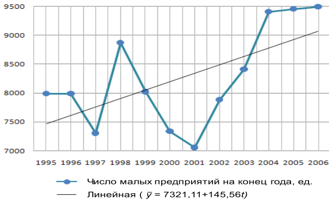
Рис. 1. Динамика числа малых предприятий в Ярославской области

Изменяясь скачкообразно, среднесписочная численность работников малых предприятий в общем в 1995–2003 годах снижалась, и только последние годы стала неуклонно расти (рис. 2).