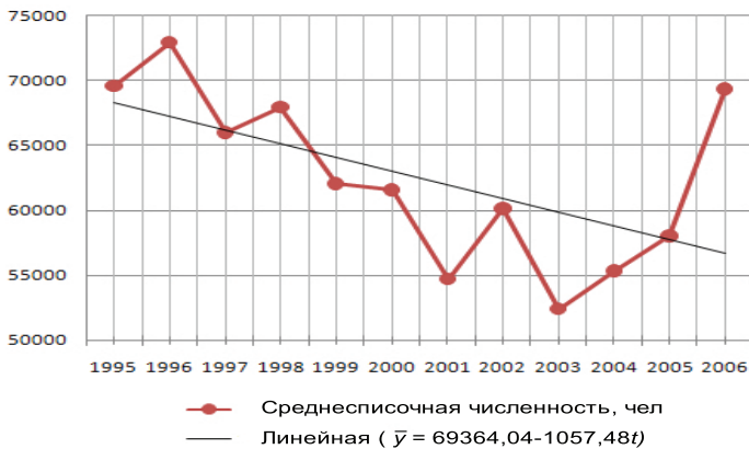
Рис. 2. Динамика численности работающих в малых предприятиях Ярославской области

Изменяясь скачкообразно, среднесписочная численность работников малых предприятий в общем в 1995–2003 годах снижалась, и только последние годы стала неуклонно расти (рис. 2).