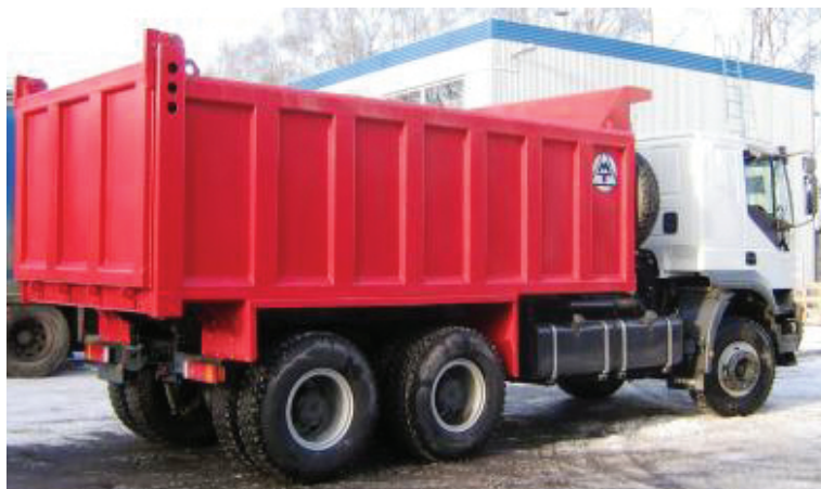
РИС. 4. Автосамосвальный кузов, произведенный в г. Переславле

Для реализации проекта требуется 20 миллионов рублей, которые пойдут на следующее: покрытие арендой платы; обустройство и реконструкцию арендуемых площадей; закупку оборудования и инструментов, спецодежды, программного обеспечения; разработку проектов и конструкторской документации, сертификацию производства; набор персонала и заработную плату; закупку материалов и комплектующих для производства первой партии кузовов.