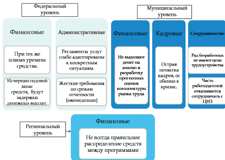
Рис. 2. Трудности работы Центра занятости населения г. Переславля-Залесского по уровням управления содействия занятости

Вследствие роста безработицы и дефицита финансовых средств была ограничена профессиональная подготовка. Например, на обучение в 1-ом квартале 2009 года профессии водителя записалось 30 человек, а ЦЗН под силу обучить только 10 человек. Потребовалось введение следующих приоритетов отбора: прежде всего, на обучение принимались установленные законом слабо защищенные категории, а остальные проходили тестирование. Показавшие слабые результаты отсеивались.