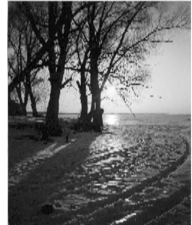
«Зимнее солнце».

на Покровскую церковь со стороны реки Трубеж» (Мареев Евгений, г.Переславль).