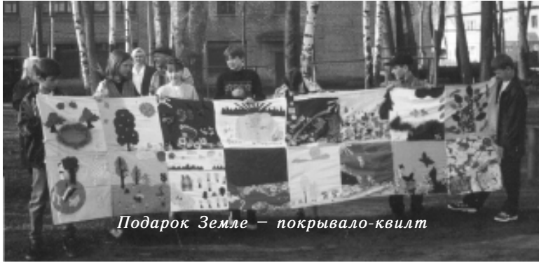
Подарок Земле – покрывало-квилт

Голубая планета! Родина всего человечества! Я обращаюсь к тебе от имени твоих неразумных детей. Прости нас, Земля! Прости, что день за днем по кускам Рвем твои легкие – зеленые леса. Прости, что дробим твои кости – горные хребты – В поисках того, что, вроде бы, нужно нам. Прости, что трюмами плотин перекрываем твои артерии – Некогда полноводные реки. Прости, что иссушаем твои глаза – моря и озера. Прости, что уродуем некогда безмятежный лик Язвы мегаполисов и рубцами ядерных ожогов. Прости, что портишь твою голубую вуаль – Атмосферу – озоновыми дырами... Прости и подскажи, как исправить содеянное нами, Как найти единственно верный путь К равновесию и гармонии Мира. И, да останутся в прошлом Глобальные экологические катастрофы. Да не повторятся в будущем. Мир тебе, планета Земля! Твои неразумные, но любящие тебя, дети!